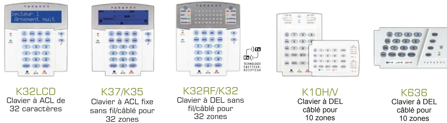
K32LCD Clavier à ACL de 32 caractères